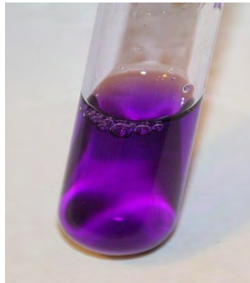
Fig. 4 Cristal Violeta