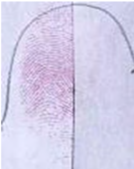
Fig. 3 Metiltioninhidina (5-MTN)