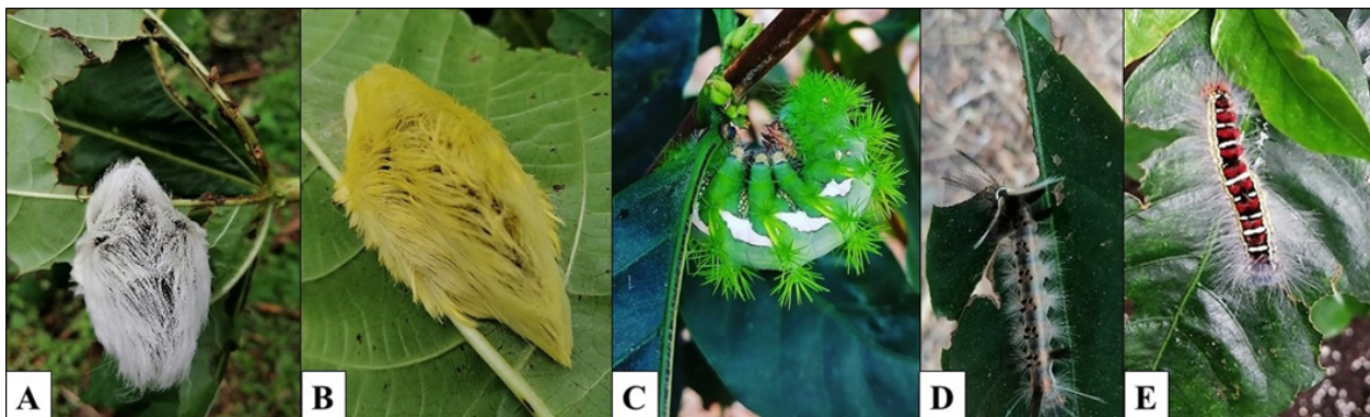
Figura 2. Orugas urticantes en agroecosistemas cafetaleros de Río Sereno: A) Morfotipo blanco de Megalopyge opercularis defoliando E. poeppigiana ; B) M. opercularis , morfotipo amarillo; C) Automeris zozine en café; D) Carales astur defoliando café; E) Euglyphis amathuria en café.