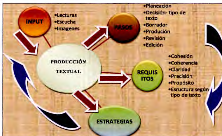
Infograma 1. Producción de textos

Atendiendo a lo anterior, este estudio parte del ejercicio práctico del enfoque por procesos hasta llegar al enfoque de producto. Por lo tanto, inicialmente se consulta acerca de los contenidos y estrategias más llamativas para los estudiantes que pueda generar en ellos un cambio positivo de actitud frente al aprendizaje; de este modo, se construyen actividades escritas focalizadas al área de inglés para primaria tomando como referencia los estándares por competencias planteados por el MEN. En ese sentido, subyacen algunos criterios que son claves para poder asegurar la claridad y precisión del texto, tales como tener en cuenta la organización del contenido, los rangos gramaticales, uso apropiado del vocabulario, complejidad de la estructura de las oraciones, uso de puntuación adecuada y fluidez en el uso de expresiones o modismos.