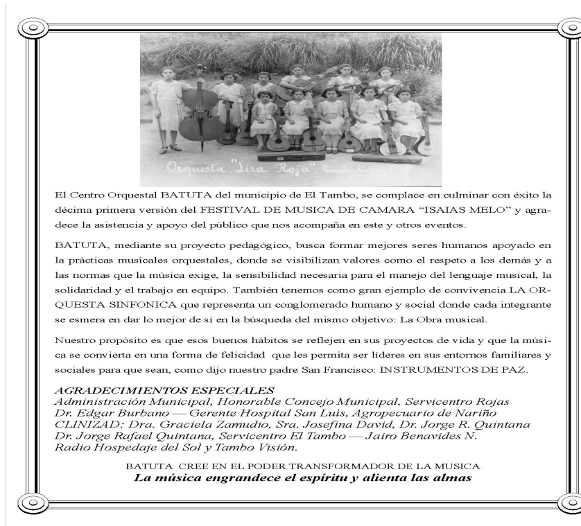
Fig. 6. Programa de Concierto XI festival de música de cámara "Isaías Melo". Año 2013.