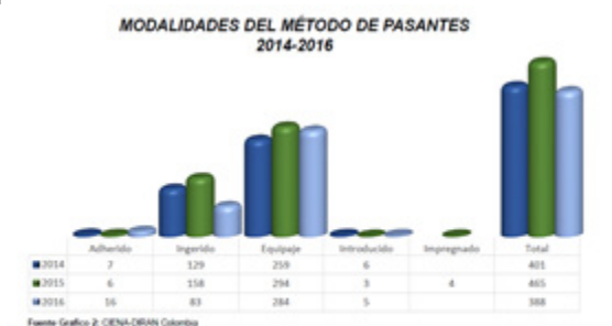
La gráfica 2, muestra las modalidades del método de ocultamiento, identificadas en los diferentes aeropuertos de Colombia; presentándose durante los tres años de estudio un total de 1.254 casos en donde se evidencia entre los más utilizados: equipaje, correspondiente al 67% del total de casos en todo el estudio.