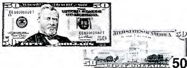
Billete de $50.00: